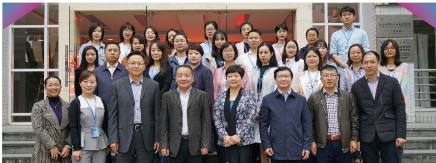
案例一：宁夏外事翻译业务专题培训班